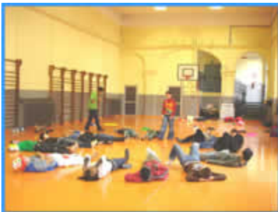
Circostanza all'CTP Parini di Torino